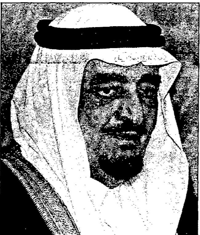
الملك فهد بن عبد العزيز

اليوم السابق لدخول الملك المستشفي وقضى في الامال في اي تحرك سريع من جانب اوبك لرفع اسعار النفط المنخفضة من التي مستوياتها منذ ما يقرب من عشرة اعوام.